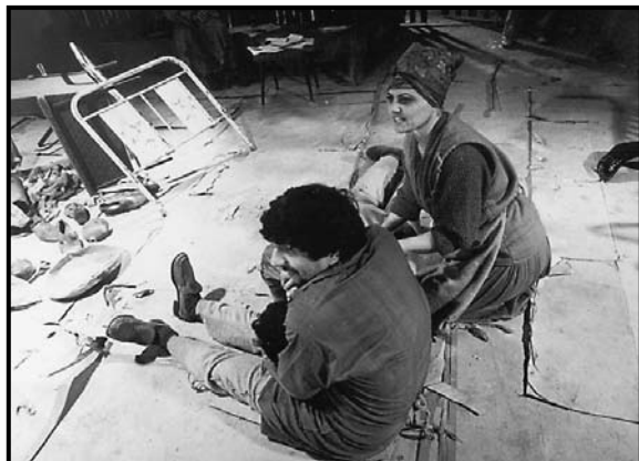
People and Pigeons by Irfan Belyur; directed by Rahim Burhan; produced by the Romany Pralipe Theatre, 1964.

Луѓе и тулаби , Ирфан Бељур; режија Рахим Бурхан; продукција: Театар на Ромите „Пралипе“, Скопје, 1964 год.