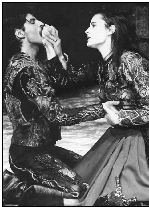
Blood Weddings by Federico Garcia Lorca; directed by Rahim Burhan; produced by Theater an der Ruhr, Mulheim, 1991.

Крвави свадби , Федерико Гарсија Лорка; режија Рахим Бурхан; продукција: Theater an der Ruhr, Mulheim, 1991 год.