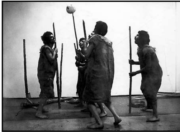
Soske , by Rahim Burhan; directed by Rahim Burhan; produced by the Romany Pralipe Theatre, Skopje, 1977.

Соске , текст и режија: Рахим Бурхан; продукција: Театар на Ромите „Пралипе“, Скопје, 1977 год.