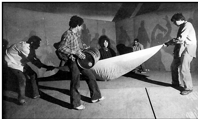
There Was and There Is ; theatricalization of the motifs from the prose work of M. A. Asturias; dramatised and directed by Rahim Burhan; produced by the Romany Pralipe Theatre, Skopje, 1976.

Беше и има ; театрализација на мотивите од прозата на М. А. Астуриас; драматизација и режија Рахим Бурхан; продукција: Театар на Ромите „Пралипе“, Скопје, 1976 год.